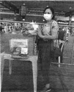
Doação realizada em um dos pontos de vacinação da Prefeitura

LUTA CONTRA A COVID Nessa quarta-feira (7), foram vacinadas contra a Covid-19 idosos com 67 anos, nascidos entre julho e dezembro. Já nesta quinta-feira (8), começaram a ser imunizadas pessoas de 60 anos. Apenas serão vacinadas nesta data pessoas que fazem aniversário entre janeiro e junho. Para a vacina, é fundamental estar cadastrado na plataforma Vacina São Luís. O cadastramento é feito no site da Prefeitura e quem não tiver acesso à internet pode se dirigir de segunda à sexta-feira a uma das unidades de saúde municipais para fazer o procedimento. Foi aberto cadastro prévio de pessoas a partir